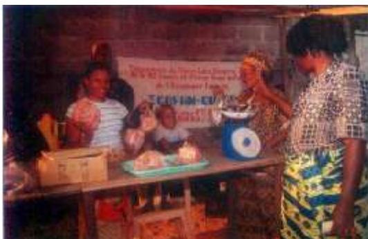
Vendo-tablo, je 30 metroj de la fiŝvendejo. Ĉi-sube unu el la kongelujoj, kun enteneco de 500 litroj.