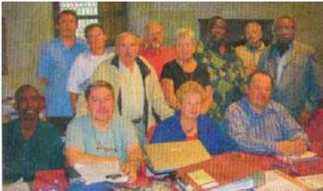
La Administra Konsilantaro de MSM kunvenas ĉiun trian monaton.

Ili profitas de tiuj malgrandaj monsumoj metitaj je ilia dispono dum 3 aŭ 6 monatoj por aĉeti laŭ la sezono legomojn, grenojn, karitean buteron, ktp. kiujn ili podetale revendas sur la bazaroj. La profitoj tiel havigitaj ebligas ilin aŭtonomiĝi por aĉeti por siaj infanoj diversajn nutrajn produktojn, lerneajn provizojn, kuracilojn ĉe la loka flegejo, por ke la infanoj estu akceptataj en la manĝejoj de la lernejoj ofte malproksimaj, kaj ankaŭ por aĉeti vivnecesajn produktojn... La kontraktoj subskribitaj por ĉiu el tiuj inoj