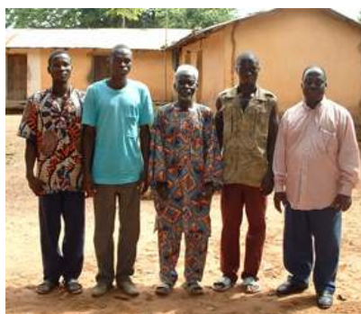
Deux groupements de la région de Sokodé :