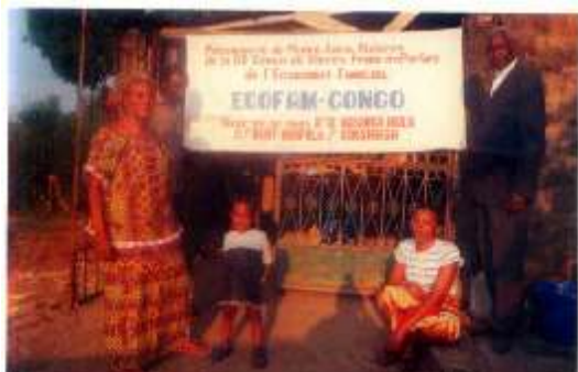
Maison de la poissonnerie et vivres frais achetés par l'ECOFAM-Congo.