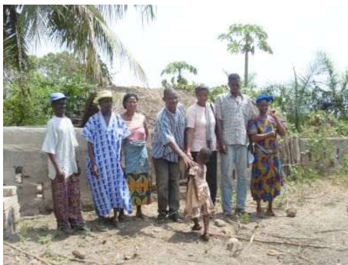
Vizito la 9an de februaro

Ĝi jam posedas du porkinojn kaj iniciatas kuniklobredadon. Ĝi kultivas maniokon, kiu fariĝos nutraĵo de la porkidoj.