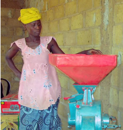
Sinignansigui de Dodougou, achat d'un moulin à grains