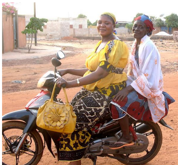
Yérélon de Koua : 1ère rencontre avec ce groupement féminin dont l'activité est le petit commerce (vente de céréales, bois de chauffe...)

Les échanges ont porté sur les décisions prises à l'AGA et les modalités de financements des nouveaux projets. Des contacts téléphoniques ont été pris avec l'Association Marie Reine, les groupements Solidarité et Péfourou 3.