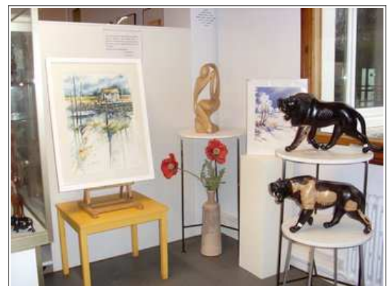
un coin de l'exposition

Cette manifestation a rapporté 681 € à SMF. C'est peu au regard des besoins mais c'est déjà ça.