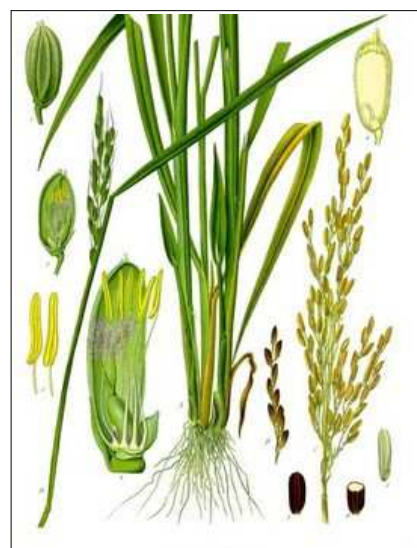
« Oryza sativa »

La teneur en protéine est 2 % plus élevée. Le rendement est d'environ 4,5 tonnes à l'hectare par rapport au Riz rouge autochtone Oryza Glaberrima (0,5-1t/ha). La réussite est là pour les nouvelles variétés de riz de ces Petits Périmètres Irrigués Villageois (PPIV) et ces variétés sont très recherchées par les citadins et par la population locale.