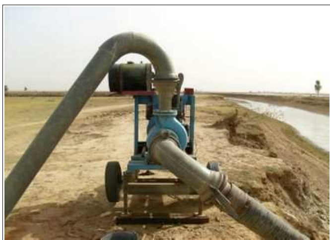
Photo 2 : Groupe Motopompe (GMP) d'irrigation

Comment les agriculteurs arrivent-ils à maintenir, voire à améliorer leur mode de production principale dans ce contexte d'insécurité climatique et socio-politique encore plus aggravé depuis avril 2012 avec les opérations d'Al Qaïda au Maghreb Islamique (AQMI) au Nord du Mali ? Face à l'absence d'une tradition d'irrigation chez les agriculteurs, la gestion de l'eau dans les Petits Périmètres Irrigués Villageois (PPIV) aménagés au début des années 1990 est un objectif nouveau et ce renouvellement de pratiques participe d'un ensemble d'innovations qui caractérisent les dynamiques villageoises.