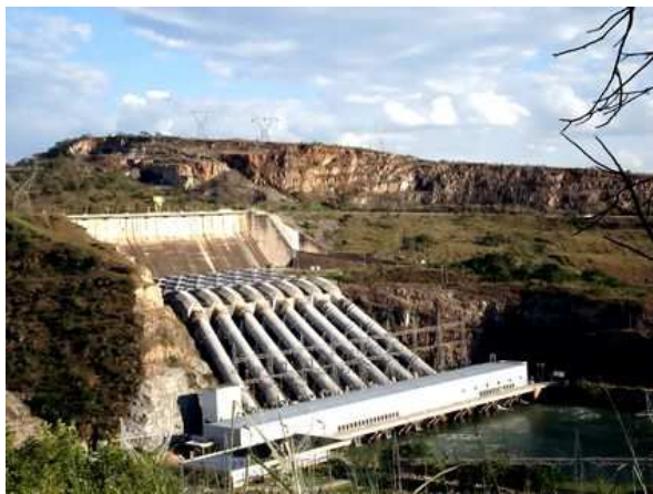
Ekzemplo de baraĵo

Por kontentigi siajn energiajn bezonojn Brazilo konstruas multajn baraĵojn en la riveregoj. Vidante siajn terenojn minacataj la indiĝenaj popoloj plene mobiliziĝas kontraŭ la laborejoj. Manifestacioj arigas la ĉeriverajn komunumojn, la religiajn ĉefojn kaj ili marŝadas laŭ la ritmo de la tradiciaj kantoj kaj paroladoj, asertante, ke la diverseco de la energiaj fontoj estas ebla, kaj denuncante la intereskonfliktojn ekzistantajn por elekti baraĵojn.