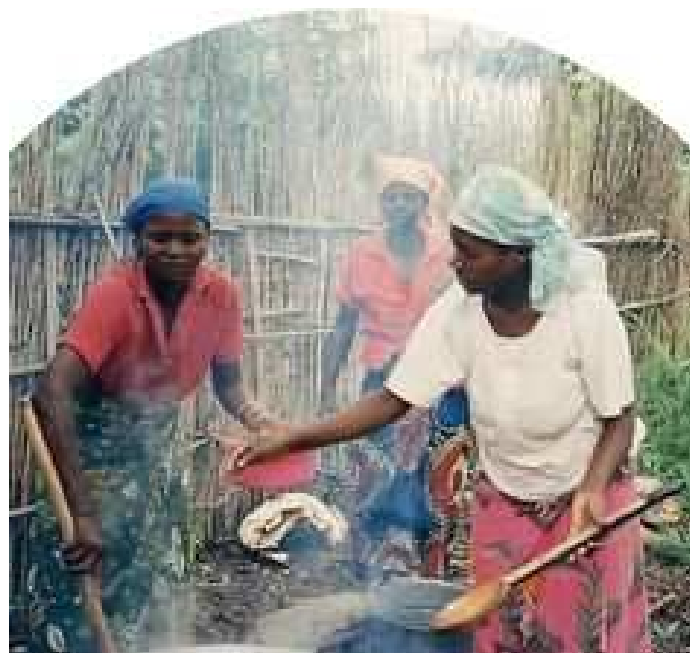
Kuirado en la prinutra centro de Mboko (Kongio)

Ĉie tra la mondo viroj, inoj indignas, protestas kaj reelektas siajn vivmanierojn. Foje per amasmediaj agadoj kiel tiuj ĵus nomitaj, foje senbrue, modeste sed ĉiam en plena civitana konscio kaj remetante homan centren de la decidoj. Tie situas MSM silente kontribuante en la antaŭgardo kaj disvolvado de agrikultura proksimeca produktado per la financado de malgravaj projektoj adaptitaj al la kamparanoj, ĉar proponitaj kaj ellaboritaj de ili mem kaj harmonie kun la lokaj kondiĉoj. MSM estas ankaŭ konstante kun tiuj, kiuj provas gardi mondon eltenebla, home eltenebla.