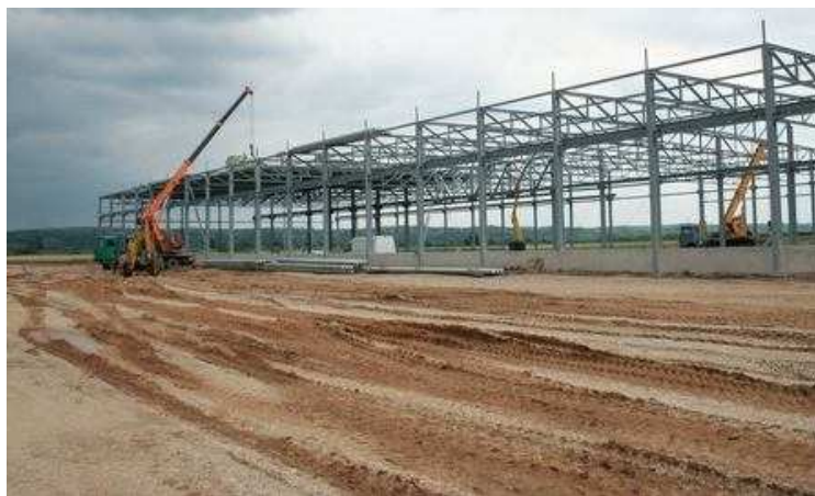
Ekzemplo de konstruado sur eksa agro

Ĉie tra la mondo homoj indignas, provas defendi la terenon por plu vivi harmonie kun sia medio protektante ĝin.