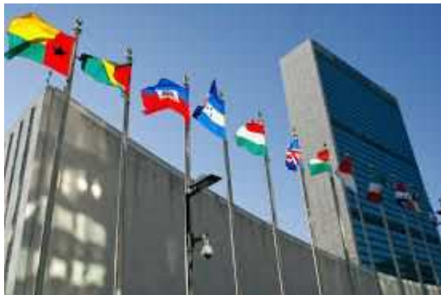
Novjorka sidejo de UN

Eĉ se Monda Solidareco, nia bulteno, malmulte parolis pri ili, ni memoras verŝajne pri la promesoj, kiujn la mondo faris al si okaze de la transiro al la tria jarmilo. Aprobataj en 2000 de 193 ŝtatoj la Jarmilaj Evoluigaj Celoj (JEC) multe kontribuis al la sentivigo de la politikaj kaj ekonomiaj respondeculoj pri la devigo batali kontraŭ la ekstrema malriĉeco de la sudaj landoj, en ĉiuj ĝiaj formoj.